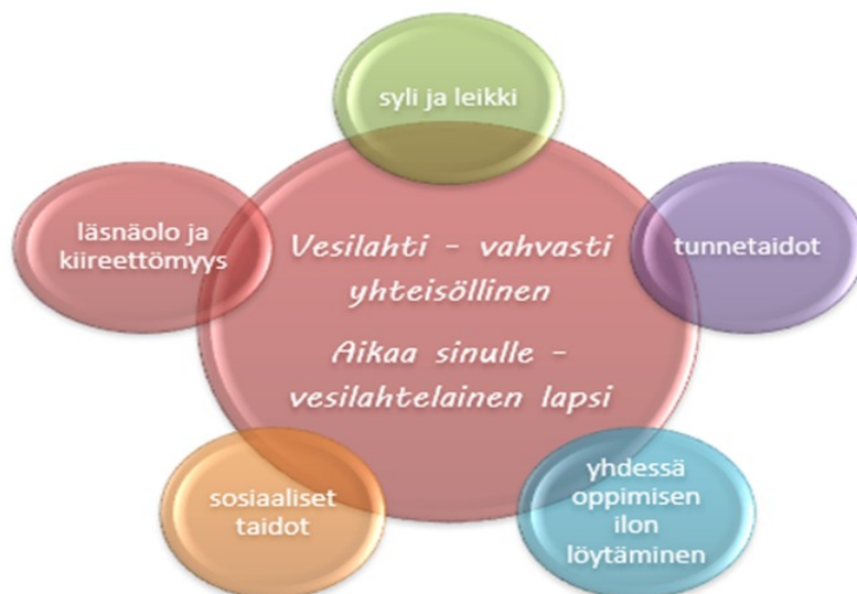
Kuvio 1. Vesilahden varhaiskasvatuksen visio

Pedagogiikkaa toteutetaan varhaiskasvatuksen toimintakulttuurissa, oppimisympäristöissä sekä kasvatuksen, opetuksen ja hoidon kokonaisuudessa siten, että lapsen päivästä muodostuu eheä kokonaisuus. Varhaiskasvatuspäivä on kaikkine toimintoineen arvokas ja merkityksellinen; toiminta on tavoitteellista ja suunnitelmallista koko päivän ajan. Totutut toimintatavat ja rakenteet tulee arvioida ja suunnitella vastaamaan joustavaa ja pedagogista kokonaispäiväajattelua.