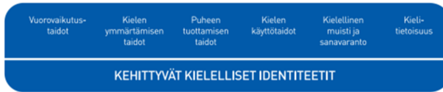
Kuvio 2. Lasten kielen kehityksen keskeiset osa-alueet varhaiskasvatuksessa

Vuorovaikutustaitojen kehittymisen kannalta lasten kokemukset kuulluksi tulemisesta ja siitä, että heidän aloitteisiinsa vastataan, ovat tärkeitä. Henkilöstön sensitiivisyys ja reagointi myös lasten non-verbaaleihin viesteihin on keskeistä. Vuorovaikutustaitojen kehittymistä tuetaan kannustamalla lapsia kommunikoimaan toisten lasten ja henkilöstön kanssa.